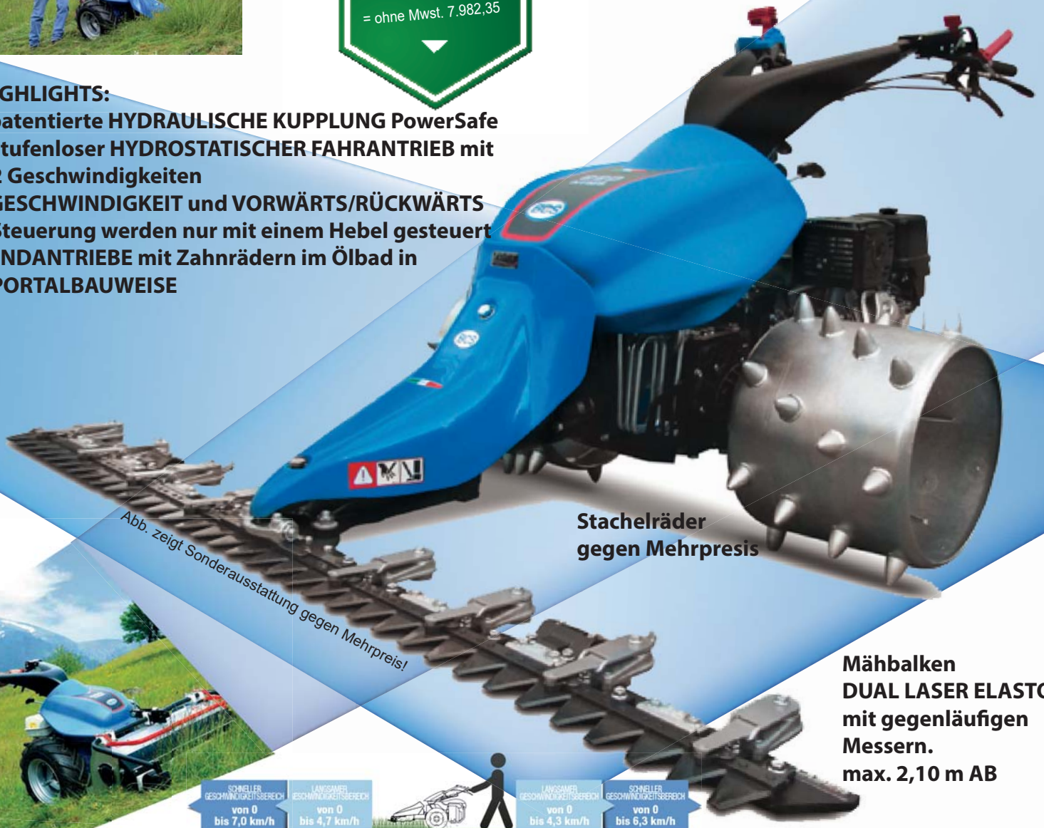
Abb. zeigt Sonderausstattung gegen Mehrpreis!

Mähbalken DUAL LASER ELASTO mit gegenläufigen Messern. max. 2,10 m AB