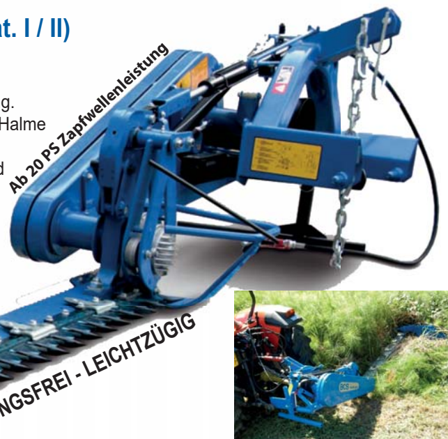
Das Duplex Mähwerk wird teilmontiert in Transportverpackung mit Gelenkwelle und Ersatzmesser geliefert!

Ab 20 PS Zapfwellenleistung WARTUNGSARM - VERSTOPFUNGSFREI - LEICHTZÜGIG